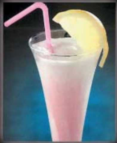
SORBETTO diverse Sorten